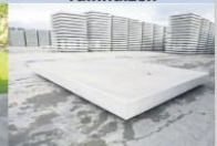
Betonplaten en Keerwanden